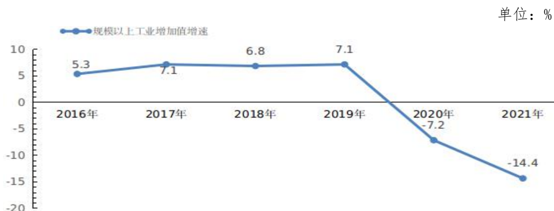
图 2 2016-2021 年全县规模以上工业增加值增长速度

全县规模以上主要产品产量多数下降。其中：铁合金增长 151.9%、铝材增长 11.7%、饮料酒增长 21.4%、电解铝增长 5.3%、石墨及碳素制品增长 42.5%、硫酸增长 1.9%、纸制品下降 6%、乳制品下降 71.9%、自来水生产量增长 10.9%、化肥下降 23.8%、单晶硅下降 46.9%、水泥下降 21.4%。