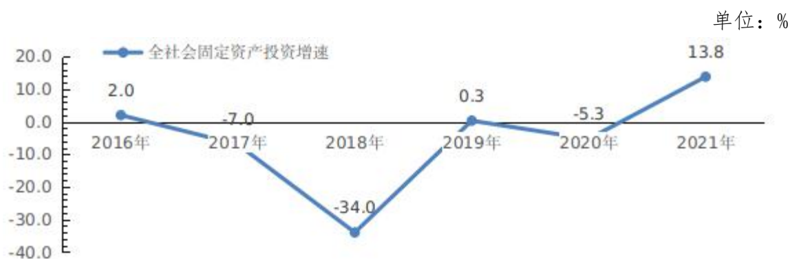
图 3 2016-2021 年全县全社会固定资产投资增长速度

全年房地产开发投资 6.6 亿元，同比增长 33.7%，其中：住宅投资 5.3 亿元，同比增长 56%。商品房屋销售面积 15.4 万平方米，同比下降 24.4%，其中：住宅销售面积 13.5 万平方米，同比下降 26.6%；商品房待售面积 31.8 万平方米，同比增长 7.7%，其中：住宅待售面积 11.2 万平方米，同比下降 2.6%。商品房销售额 7 亿元，同比下降 10.7%，其中：住宅销售额 6 亿元，同比下降 12.4%。